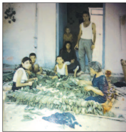
Επεξεργασία καπνού στο Βασιλί Καρπασίας

Η καπνοπαραγωγή υπήρξε η κυριότερη ενασχόληση των Βασιλιωτών, που περιόρισε άλλες παραδοσιακές καλλιέργειες, όπως τα αμπέλια, τα βαμβάκια, τα σησάμια, τα δημητριακά, τις ελιές και τα κηπευτικά. Στην ανάπτυξη της συνέβαλε μετά την Ανεξαρτησία η ίδρυση του Συνεργατικού Οργανισμού Καπνοπαραγωγών (ΣΟΚ), όπως και η δημιουργία της Καπνικής Υπηρεσίας για καθοδήγηση των καπνοπαραγωγών στις νέες μεθό-