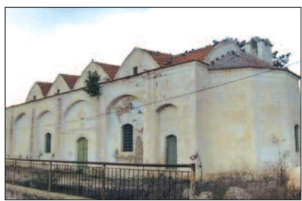
Η εκκλησία του Αγίου Βασιλείου στο Βασιλί

Το χωριό, όπως επισημαίνει και πάλι ο Φραγκούδης, είναι αφιερωμένο στον Άγιο Βασίλειο, στον οποίο οφείλει την ονομασία του, ενώ κατά μία άλλη εκδοχή ονομάστηκε από τον πρώτο οικιστή του, εξ ου και η φράση «πάμε στο σπίτι του Βασίλη». Ωστόσο, την αγιολογική ονομασία ενισχύει Ενετικός χάρτης, όπου αναγράφεται ως S.Vasili, όπως και ο φερώνυμος ναός του. Σε μια σύντομη ιστορική αναδρομή από τον 11ο π.Χ. μέχρι τον 19ο μ.Χ. αιώνα αναφέρουμε τα ακόλουθα: