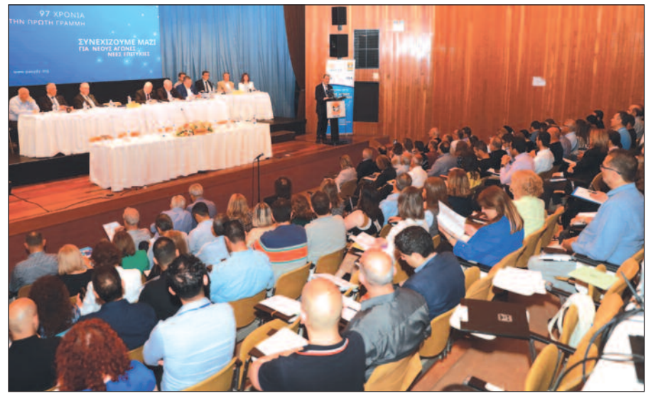
Φωτογραφία αρχείου από το 61ο Συνέδριο των Αντιπροσώπων στην αίθουσα Συνεδρίων της Οργάνωσης μας Μιχαλάκης Καραολής.

Η οριστική Έκθεση Πεπραγμένων θα εκτυπωθεί μέχρι την Παρασκευή 21 Μαρτίου 2025, ώστε να είναι έτοιμη προς διανομή στους Αντιπροσώπους μαζί με το υπόλοιπο υλικό για το Συνέδριο την Παρασκευή 28.03.2025.