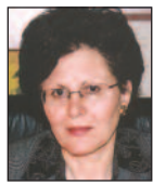
Της Χρυσοθέμιδος Χατζηπαναγή

Σ την περιφέρεια Καρπασίας της επαρχίας Αμμοχώστου άλλο ένα τουρκοκατεχόμενο χωριό μας, το Βασιλί, έχει να μας διηγηθεί πολλά από την πανάρχαια έως την πρόσφατη ιστορία του. Συνορεύει βόρεια με τον Άγιο Ανδρόνικο, νότια με την Κώμα του Γιαλού, ανατολικά με τη Λυθράγκωμη και ως προς την κοντινή γειτνίασή του στα δυτικά με το Λεονάρισσο, τα δύο χωριά παρουσιάζονται σαν ένα, σύμφωνα με τον Τζέφρυ και τον Γ.Σ. Φραγκούδη, ο οποίος συγκεκριμένα σημειώνει: «Μίαν ώραν μετά ταύτα απαντώνται ο Λεονάρισσον, όπερ μετά του πλησίον Αγίου Βασιλείου αποτελεί σχεδόν μίαν και την αυτήν κώμην». Τοποθετημένο σε λοφοπλαγιά και σε υψόμετρο 1.30μ. πάνω από τη θάλασσα στάθμη, δεσπόζει στο μέσο της βόρειας και της νότιας θάλασσας της Καρπασίας. Είναι η «Διθαλάσσου» της ομώνυμης ποιητικής συλλογής του Βασιλιώτη Νίκου Νικολάου-Χατζημιχαήλ.