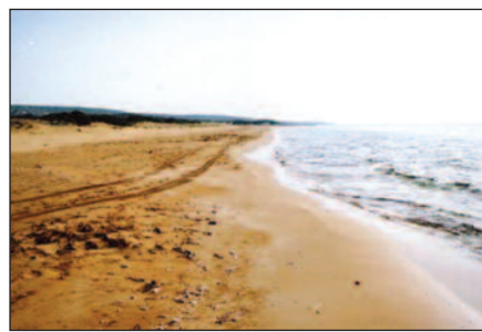
Η περιοχή Λούματα, μια από τις ωραιές ακτές στο Βασιλί Καρπασίας

δους καλλιέργειας και αποξήρανσης του καπνού. Η ανάπτυξη της αιγοπροβατοτροφίας βασίστηκε κυρίως στην αξιοποίηση των ξηρικών εκτάσεων. Το τμήμα Γεωργίας εφάρμοσε στην Καρπασία το Σχέδιο Μικτής Γεωργίας-Κτηνοτροφίας, παραχωρώντας επιχορηγημένες τιμές ζωοτροφών και ενθαρρύνοντας την καλλιέργεια κτηνοτροφικών φυτών. Στην περιοχή «Λούματα» ή «Λούμαν», μια από τις ωραιότερες αμμώδεις παραλίες της Κύπρου, στα νοτιοανατολικά του χωριού, οι βοσκοί έλουζαν τα κοπάδια τους.