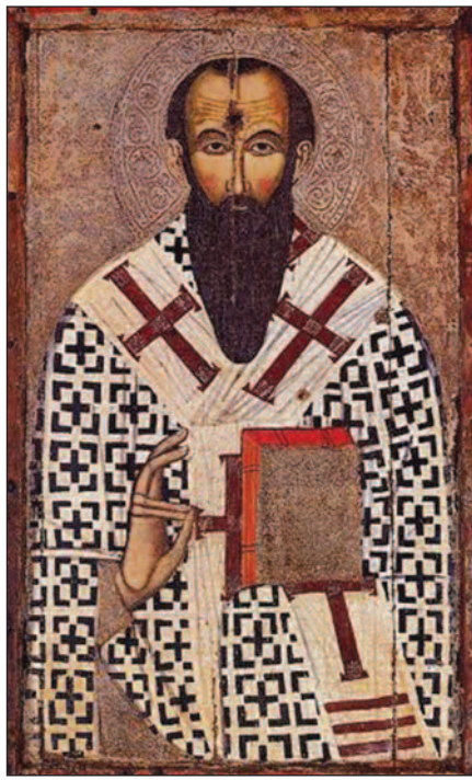
Άγιος Βασίλειος ο Μέγας

Από τους θαλαμωτούς λαξευτούς τάφους με διάφορα κτερίσματα, που ανακαλύφθηκαν στους λόφους Μάντρα του Κατσικά και Λιμπρούες, η πρώτη κατοίκηση του χωριού τοποθετείται κατά τη Γεωμετρική-Αρχαϊκή εποχή (11ος-5ος αι-