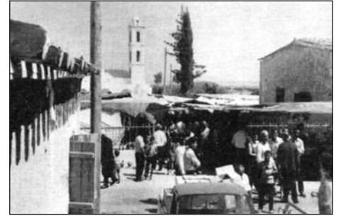
Πανηγύρι στην Καλοψίδα, 29 Αυγούστου 1971

τάφους σε διάφορα αντιπροσωπευτικά τμήματα του νεκροταφείου, όπως και έναν τοίχο από αργούς λίθους στην κορυφή του λόφου, που υπάγεται στην τοποθεσία Γαστρικά και διαχωρίζεται από τον δρόμο. Πρόκειται για λαξευτούς τάφους μέσα στο φυσικό ασβεστολιθικό βράχμα με ομοιόμορφο νεκρικό θάλαμο ακανόνιστου κυκλικού σχήματος. Παρά τη σύλησή τους στο απώτερο παρελθόν, τα νεκρικά κτερίσματά τους περιλαμβάνουν αρκετά πήλινα αγγεία, μεγάλη ποικιλία χάλκινων αντικειμένων και έργων μικροτεχνίας, μερικά των οποίων είχαν εισαχθεί από την Εγγύς Ανατολή και την Αίγυπτο, πολλά όμως φαίνεται ότι κατασκευάστηκαν στην περιοχή της Καρπασίας και σε άλλα μέρη της Κύπρου. Από το σύνολο των ταφικών ευρημάτων μόνο ελά-