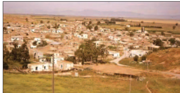
Καλοψίδα - Γενική άποψη του χωριού

Την αρχαιότητα του χωριού αποδεικνύει η Ελληνική του ονομασία. Κατά τον Σίμο Μενάρδο, είναι, προφανώς, αρχαϊκή από τη λέξη καλοψίς, ήτοι περιοχή με καλά όψα (ορεκτικά), εάν όχι από τις λέξεις καλή όψις. Το χωριό υφίστατο κατά την περίοδο της Φραγκοκρατίας με το ίδιο ακριβώς όνομα, παρότι σε παλαιούς χάρτες σημειώνεται ως Colorista. Ο ντε Μας Λατρί το αναφέρει ως φέουδο, ιδιοκτησία του κόμητα της Γιάφφας και ο Λεόντιος Μαχαίρας ότι το κατέστρεψαν οι Σαρακηνοί με την εισβολή τους στην Κύπρο το 1425. Ο Γεώργιος Βουστρώνιος στο δικό του Χρονικό γράφει ότι στις 27 Ιανουαρίου του 1473 ανακηρύχθηκε στην Αμ-