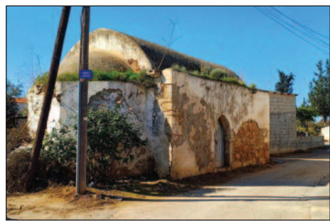
Το βουβό εκκλησάκι του Αγίου Ανδρονίου στην Καλοψίδα

Α νάμεσα στη Μεσαορία και τα Κοκκινόχωρια συναντούμε το αμιγώς Ελληνοκυπριακό τουρκοκλαβωμένο χωριό της Καλοψίδας, που απέχει περί τα 17 χλμ. δυτικά της Αμμοχώστου. Από συγκοινωνιακής απόψεως βρίσκεται δίπλα στον παλαιό δρόμο Λευκωσίας - Αμμοχώστου και στα βορειοδυτικά συνδέεται οδικώς με τα Κούκλια και μέσω του με τη Λευκωσία, στα βορειοανατολικά με τους Στύλους, με τον καινούργιο δρόμο Λευκωσίας - Αμμοχώστου και στα ανατολικά με την Αχερίτου. Ο πληθυσμός της κοινότητας σημείωσε αλματώδη αύξηση, αριθμώντας το 1881 περί τους 300 κατοίκους μέχρι την τελευταία απογραφή του 1973 που υπερέβαινε τους 1000. Οι κυριότεροι λόγοι της πληθυσμιακής αύξησης οφείλονταν στις προσοδοφόρες γεωργοκτηνοτροφικές εργασίες, τη γειτνίαση του χωριού προς τη Βρετανική Βάση της Δεκέλειας και την πολύ κοντινή απόσταση από την πόλη της Αμμοχώστου, που πρόσφεραν εργοδότηση σε αρκετούς Καλοψιδιώτες.