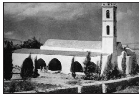
Ο ναός του Τιμίου Προδρόμου στην Καλοψίδα πριν το 1974

θεσίες Κουφός, Τραπέζια, Βούρνες και Γαστρικά, καλύπτοντας μιαν έκταση τεσσάρων περίπου τ. χλμ. και χωρίζεται σε δύο μέρη από τον παλαιό κύριο δρόμο Λευκωσίας - Αμμοχώστου, μαρτυρείται ότι υπήρξε ένας οικισμός ή σημαντική πόλη με μεγάλο νεκροταφείο, που αναπτύχθηκε ιδιαίτερα στη διάρκεια της Μέσης εποχής του Χαλκού (1900-1650 π.Χ.) και της πρώτης φάσης της Ύστερης εποχής του Χαλκού (1650 -1400 π.Χ.). Οι πρώτες ανασκαφικές έρευνες πραγματοποιήθηκαν το 1894 από τον John L. Myres και έφεραν στο φως 33 συνολικά