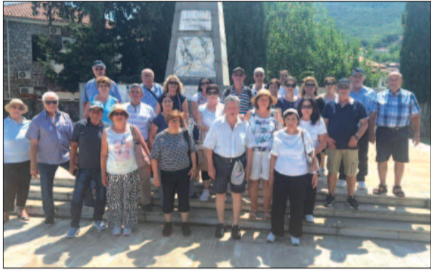
Αναμνηστική φωτογραφία στο Χάνι της Γραβιάς.

Ήταν μια εκδρομή πλούσια με επισκέψεις σε προσκυνήματα, αρχαιολογικούς χώρους και ιστορικές τοποθεσίες.