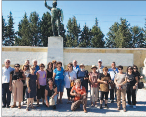
Οι εκδρομείς στις Θερμοπύλες.

Στις διαδρομές τους οι εκδρομείς επισκέφθηκαν καταπράσινα τοπία, γραφικές κοιλάδες και απέραντα δάση, κυρίως από έλατα και επέστρεψαν με τις καλύτερες των εντυπώσεων. ■