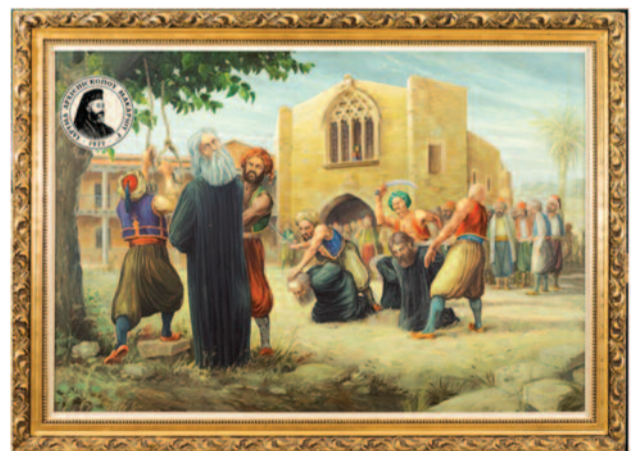
Ο Αρχιεπίσκοπος Κυπριανός όπως το φιλοτέχνησε ο γνωστός Κύπριος ζωγράφος Γιώργος Μαυρογένης.

Αζεπέραστη η κληρονομία για μας αλλά και ολόκληρο τον Ελληνισμό η απάντηση του Αρχιεπισκόπου Κυπριανού: « Η Ρωμοσύνη εν' φυλή συνότταιρε το κόσμου, κανένας δεν ευρέθηκεν για να την ιξλιεύει, κανένας, γιατί σσέπει την 'πού τα 'ψη ο Θεός μου. Η Ρωμοσύνη εννά χαθεί, όντας ο κόσμος λείψει! Σφάξε μας ούλους τ'ζι ας γενεί το γαίμαν μας αυλάτ'ζιν, κάμε τον κόσμον ματζελειόν τ'ζαι τους Ρωμιούς τραούλλια, αμμά 'ξερε πως ίλαντρον όντας κοπει καβάτ'ζιν, τριγύρου του πετάσσονται τρακόσια παραπούλια. Το 'νίν αντάν να τρώ' την γην, τρώει την γην θαρκέται, μα πάντα τζείνον τρώεται τ'ζαι τζείνον καταλυέται. »