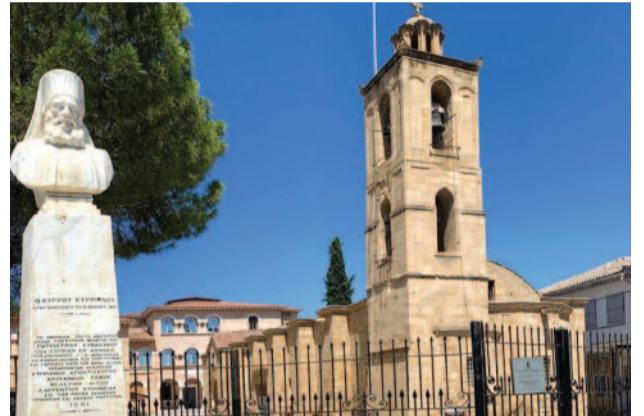
Η προτομή του εθνομάρτυρα Αρχιεπισκόπου Κυπριανού στο προαύλιο του παλαιού καθεδρικού ναού.

Μαύρο αποκαλούμε τον τρέχοντα μήνα Ιούλιο γιατί σε περασμένα χρόνια ήταν περίοδος καταστροφικών εξελίξεων και ιστορικών γεγονότων για την ιδιαίτερη πατρίδα μας και κάθε χρόνο στη διάρκεια του Ιουλίου διοργανώνουμε και πραγματοποιούμε εκδηλώσεις αλήστου μνήμης και επαναβεβαίωσης πίστης στον αγώνα μας για οριστική δικαιοσύνη. Το φετινό Ιούλη με επικεφαλής την Προεδρία της Δημοκρατίας θα πραγματοποιηθεί όπως και σε προηγούμενα χρόνια στον χώρο του Προεδρικού Μεγάρου εκδήλωση μνήμης στην οποία προσκλήθηκαν να παραστούν και επίσημοι άλλων κρατών με συμπαρατάξη της ηγεσίας του Ελληνικού κράτους.