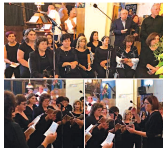
Τη Μεγάλη Παρασκευή Χορωδία του Τμήματος ΠΑΣΥΔΥ Πάφου έψαλε τα εγκώμια του Επιταφίου στον ιερό ναό της Παναγίας Θεοσκεπαστής στην Κάτω Πάφο.