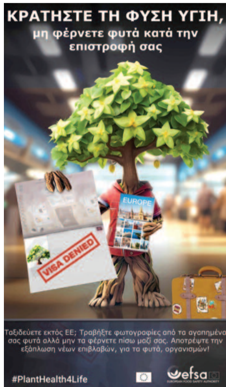
Ταξιδεύετε εκτός ΕΕ; Τραβήξτε φωτογραφίες από τα αγαπημένα σας φυτά αλλά μην τα φέρνετε πίσω μαζί σας. Αποτρέψτε την εξάπλωση νέων επιβλαβών, για τα φυτά, οργανισμών!

Ωστόσο, πολλοί Ευρωπαίοι πολίτες εξακολουθούν να μην είναι επαρκώς ευαισθητοποιημένοι σχετικά με τους λόγους για τους οποίους είναι σημαντική η υγεία των φυτών. Η εκστρατεία #PlantHealth4Life αποσκοπεί στην αύξηση της συλλογικής ευαισθητοποίησης σχετικά με τους κινδύνους που απειλούν την υγεία των φυτών και τον ρόλο που πρέπει να διαδραματίσει ο καθένας από εμάς για την προστασία των